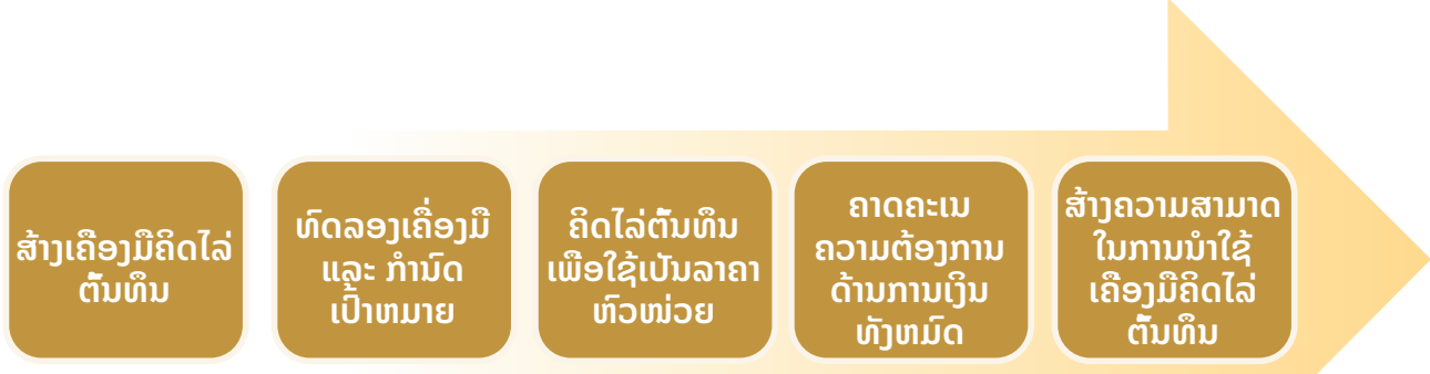
ຮູບສະແດງທີ 1. ຂະບວນການຄິດໄລ່ຕົ້ນທຶນສໍາລັບແຜນ NPAN